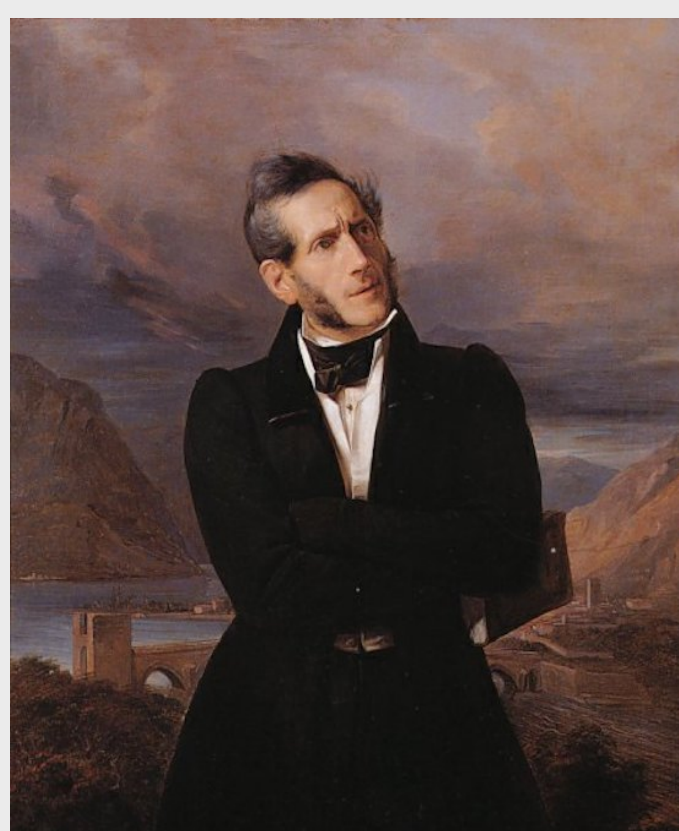
Giuseppe Molteni, Ritratto di Alessandro Manzoni, 1835, Accademia di Brera

Predda di paure e di nevrosi, prostrato dalla fatica di scrivere e tuttavia preso da raptus creativi che lo spingevano a produrre nel giro di pochi anni le sue opere più importanti – il Conte di Carmagnola , Adelchi , Il cinque maggio , Fermo e Lucia e quindi I promessi sposi –, Manzoni è rappresentato da Becherucci come un «combattente», che durante gli «anni di piombo dell'Imperial Regio Governo austriaco in Italia» ha molto rischiato e che, se non è finito allo Spielberg come gli amici Silvio Pellico e Federico Confalonieri, è solo perché ha saputo destreggiarsi «con impareggiabile abilità» tra i labirinti e le trappole della burocrazia e della polizia del Regno Lombardo-Veneto.